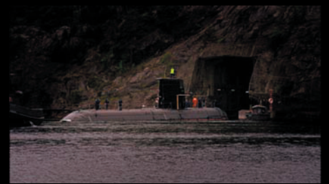
U-båt från "The Rock Race" Kund: Atlas Copco

Därför har vi producerat många utbildningsfilmer om olika ämnen under årens lopp.