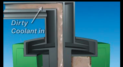
"Alfie 400" med 3D-animerad grafik Kund: Alfa Laval