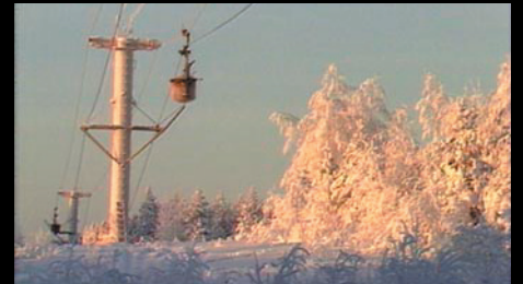
Vår första TV dokumentär "Världens längsta linbana" Kund: SVT