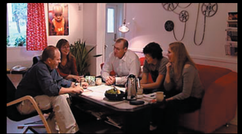
Kaffe – dryck för kreatörer

I samband med inspelningarna av nyhetsinslagen tar vi också tillfället att filma extramaterial som kan komma er till nytta i t.ex. imagefilmer eller andra sammanhang i framtiden.