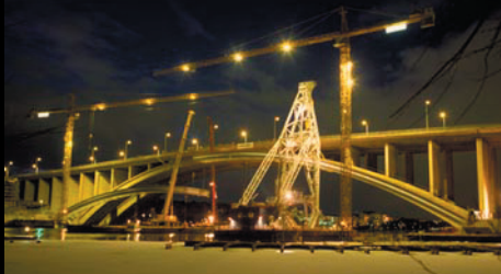
Renovering av Tranebergsbron i filmen "Bågen" Kund: Vägverket