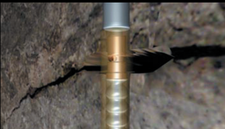
Förklaring av "SwellexHybrid" bult Kund: Atlas Copco