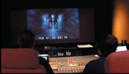
Mixning av surroundljudet till "The Rock Race" Kund: Atlas Copco