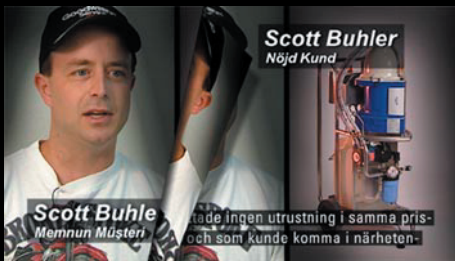
Produktreklam för "Alfie 400" gjordes i många språkversioner Kund: Alfa Laval