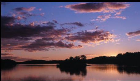
Stockholms skärgård – kreativ miljö