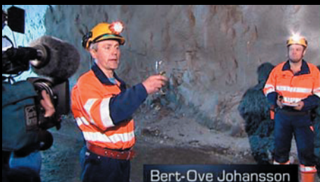
Invigning av en ny tunnel i Garpenberg Kund: Boliden AB