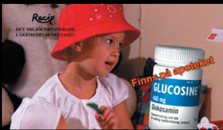
TV reklam för "Glucosine" Kund: FWD / Recip AB