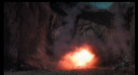
Sprängning av den nya tunneln Kund: Boliden AB