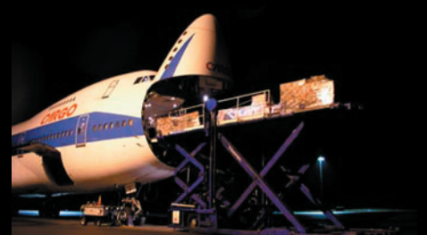
"The Move Movie" Kund: DHL Danzas Air&Ocean