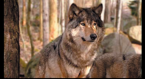
"Vargens Land", full av metaforer Kund: Gargnäs AB