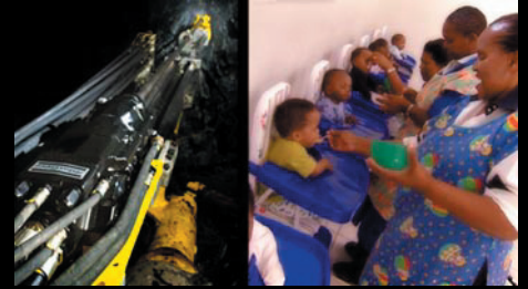
Kunder: Atlas Copco / Frälsningsarmén