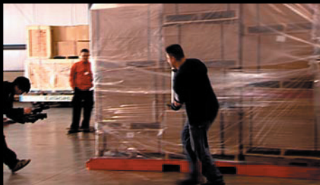
Från inspelningen av "The Move Movie" Kund: DHL Danzas Air&Ocean