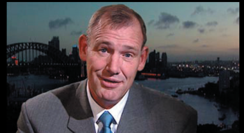
Monte mot ny bakgrund